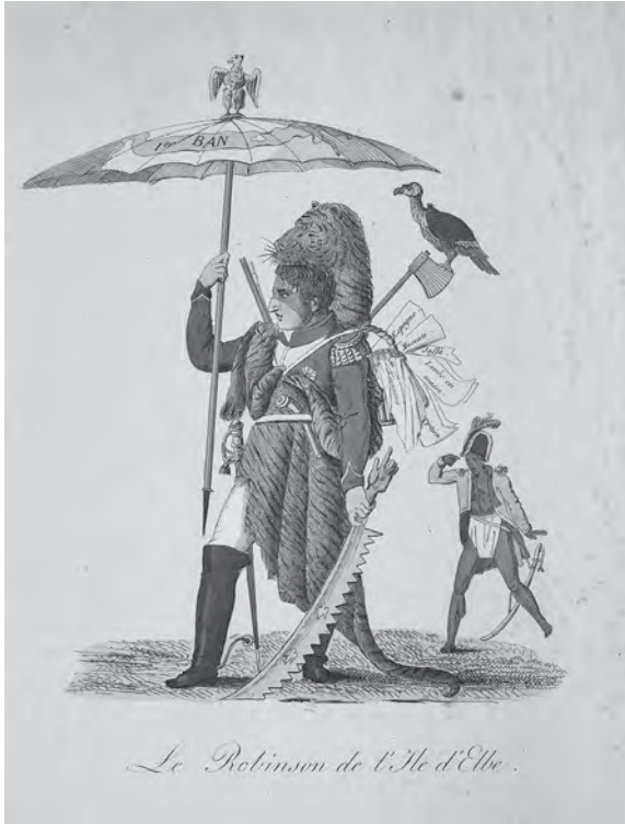
Afb. 3 Spotprent Le Robinson de l'Île d'Elbe . Atlas van Stolk (Rotterdam 1814).

Dat het verhaal van Robinson Crusoe binnen de context van de Napoleontische oorlogen inderdaad een politieke lading kon krijgen, blijkt uit het feit dat De Pixierécourt's werk in 1814 een politiek vervolg kreeg. In mei 1814, kort nadat Napoleon op het eiland Elba als banneling was aangekomen, verscheen een spotprent waarin Napoleon als Robinson Crusoe werd voorgesteld. Die prent greep direct terug op het toneelstuk van De Pixierécourt uit 1805. Robinson en Napoleon vielen in de nieuwe politieke context gemakkelijk met elkaar te verbinden: beiden zaten tegen hun wil vast op een eiland en moesten zich in die omstandigheden zien te redden. Het verschil was natuurlijk dat Robinson in principe een deugdheld was, terwijl Napoleon door de vijandige mogendheden als een moordlustige tiran werd beschouwd.