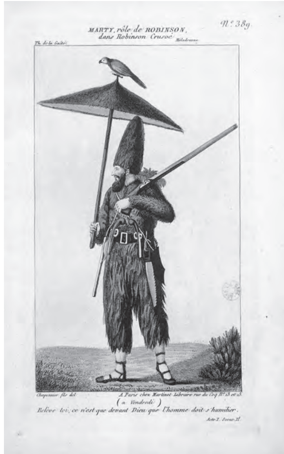
Afb. 2 Illustratie uit R.C. Guilbert-Pixerécourt Robinson Crusoé, mélodrame en trois actes, a grand spectacle (Parijs 1805). Bibliothèque Nationale de France.

de Engelsen als slechteriken naar voren komen. De vijandschap tussen Napoleon en de Engelsen bereikte in die jaren een hoogtepunt; de slag om Trafalgar zou in oktober van dat jaar uitgevochten worden. Het benadrukken van de slechtheid van personages als Atkins en Ocroli zou het stuk een anti-Engelse teneur gegeven kunnen hebben. 22 Het is onduidelijk of dergelijk politieke interpretaties ook in de Nederlandse context een rol kunnen hebben gespeeld. Van der Vijvers vertaling verscheen begin 1806; later dat jaar, op 5 juni 1806, zou Lodewijk Napoleon tot koning van Holland benoemd worden. 23 Tegen deze achtergrond kunnen uitspraken over 'goede' en 'slechte' meesters door toeschouwers politiek zijn opgevat, overigens twee richtingen op (voor en tegen de Fransen), maar concrete aanwijzingen voor dergelijke interpretaties zijn er niet.