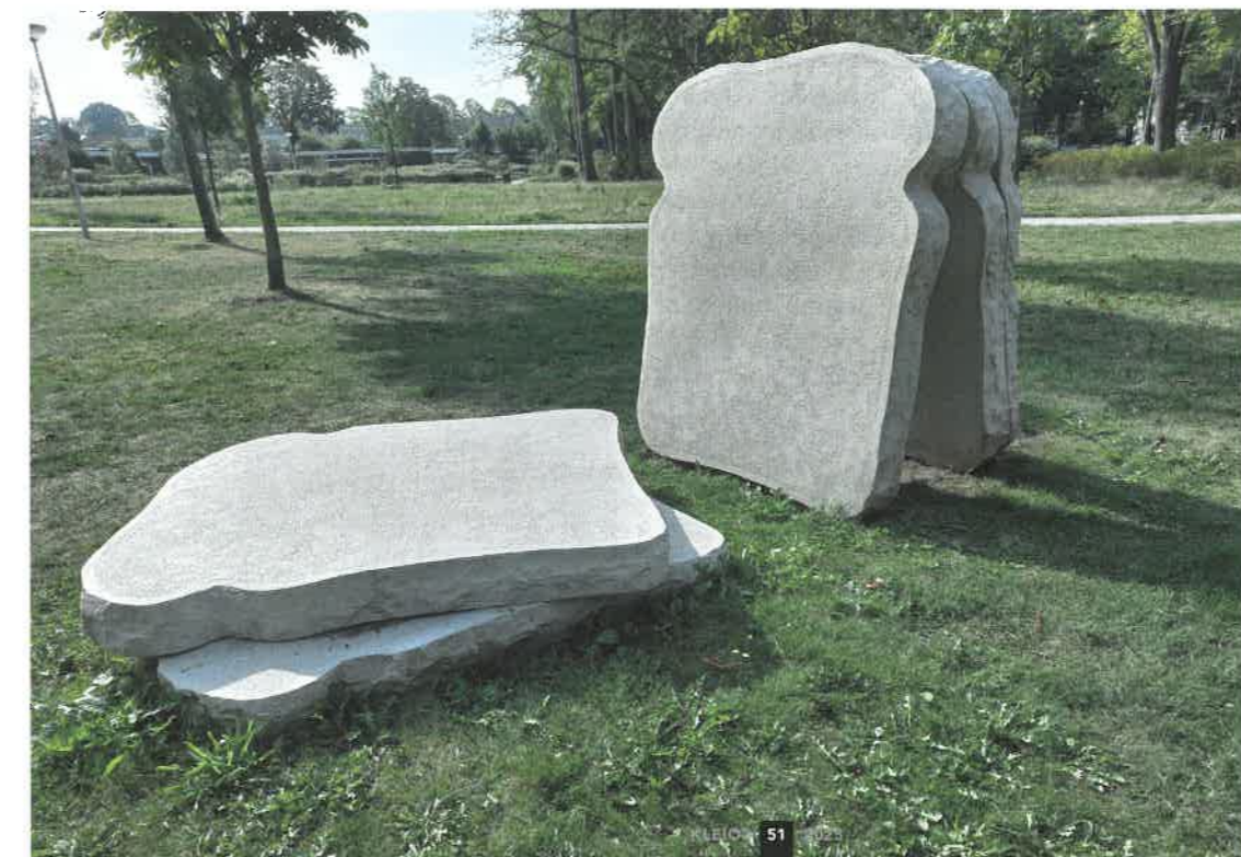
Het beeld 'Manna' van Ram Katzir in Amsterdam, 2022.