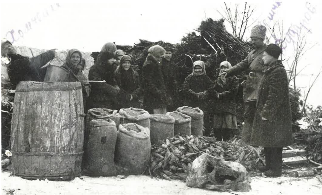
De inbeslagname van groenten tijdens de hongersnood in Oekraïne, 1932. Collectie: cvdr.