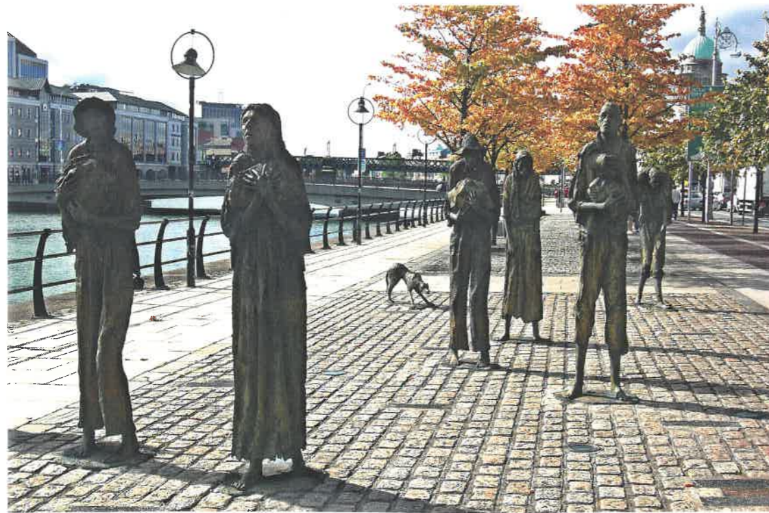
Het hongersnoodmonument van Rowan Gillespie, 2013.

het Sovjetbeleid veroorzaakte hongersnood in Oekraïne in de jaren 1932-1933) kreeg daardoor een nieuwe politieke lading. Bovendien werd de export van graan en andere landbouwproducten ernstig verstoord, wat ook in Nederland te merken was aan de hoge prijzen voor brood en zonnebloemolie. Tijdens de meest recente herdenking van de Ierse hongersnood in mei 2024 vergeleek eerste minister Simon Harris het leed van de verhongerde bevolking in Gaza met dat van de Ieren tijdens de aardappelnood om Ierlands solidariteit met de Gazanen kracht bij te zetten. Nog een ander voorbeeld: enkele jaren terug stonden burgers in Spanje als gevolg van de toenemende armoede opnieuw in de rij voor voedsel. Dat bracht de herinnering aan de 'hongerjaren' ( años del hambre ) naar boven tijdens het regime van Franco.