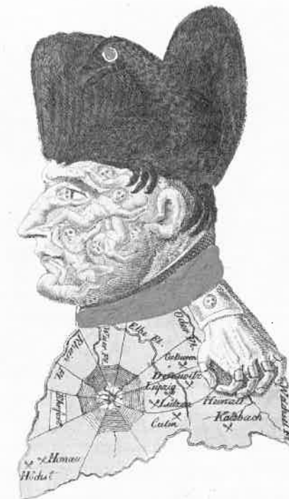
‘Triumph des Jahrs 1813’. Anonieme spotprent op Napoleon van 1813 waarbij zijn gezicht is opgebouwd uit de lijken van zijn slachtoffers. Collectie Rijks- museum, Amsterdam.

En gij, Verovraar! die, gevoelloos voor ellende, Gods Wereld hebt verwoest voor valschen glorieschijn; Het vreeslijk wraakwaard der vergelding hangt aan 't ende. Eens zal de vloek der aarde uw schorre doodzang zijn. 25