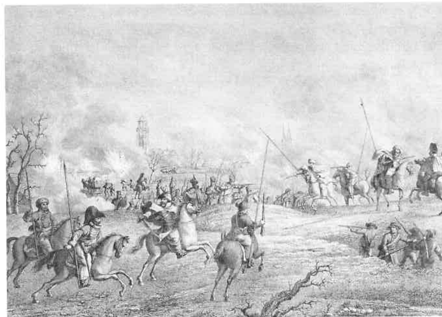
Gevechten tussen Fransen en kozakken bij Deventer, 1813.

Aan die voorjaarsdroom gaf Feith een heel specifieke invulling in maart 1813, toen hij 'De val van Napoleon' schreef. Naar aanleiding van de inname door de Russen van Hamburg, visualiseerde hij de ultieme ondergang van Napoleon. Overal zou gejuich klinken, nu de dwingeland was verslonden. Niet langer zou deze vleesgeworden duivel dood en verderf zaaien, niet langer hoefde de moeder haar zuigelingen angstig aan haar borsten te klemmen. Eindelijk, eindelijk kon de lente volop bloeien: