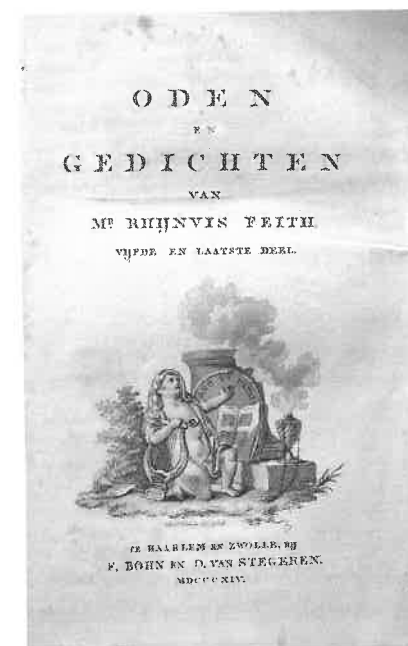
Titelpagina van Rijnvis Feith, Oden en gedichten , deel 5 (1814).

Waarom stelde Feith de publicatie van zijn gedichten in 1812 uit? Het is goed