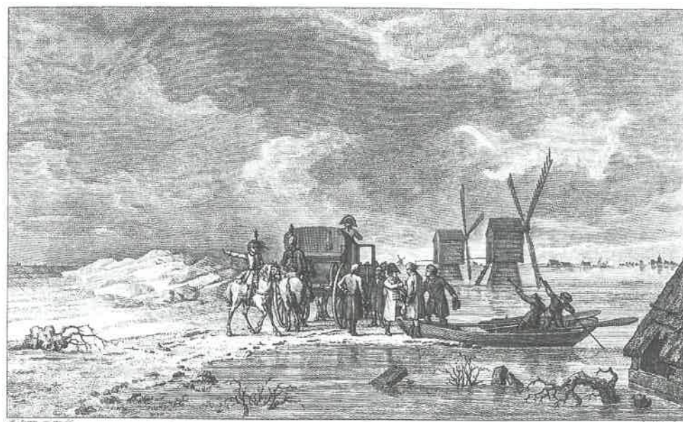
GETAAR WAAR IN DE KONING ZICH BEVONDT, OP DEN DALEMSCHEN-DYK, DOOR HET OPKRUIJEN DER YNSCHOTZEN. in Touwmanus' Nieuw